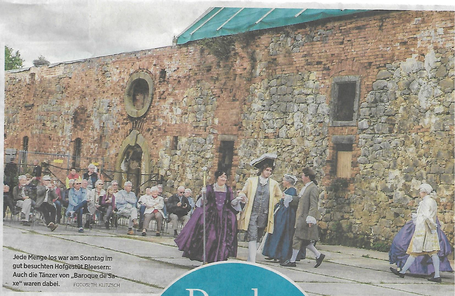
Jede Menge los war am Sonntag im gut besuchten Hofgestüt Bleesern: Auch die Tänzer von „Baroque de Saaxe“ waren dabei.