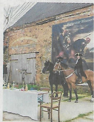
Zu einem anständigen Gestüt gehören Pferde. Nicht zuletzt die wurden Sonntag in Bleesern gezeigt. Außerdem gab es Führungen durch die alten Gemäuer.